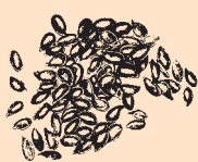
Brytyjskie brązowe siemię lniane